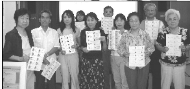
7月1日の受講生のみなさんです。この中に2000人目の人がいます。

私たち、厚木市マルチメディアボランティア（略称マルボラ）は平成 11 年 2 月 1 日に発足し、5 月から「初心者パソコン教室」を開催していましたが、“個人的な相談も・・・”との要望もあり、その年の7月 22 日から毎週木曜日 10 時～12 時まで受講者の希望する内容をマルボラが、マンツーマンでお教える「手ほどき」を開始しました。“パソコンが初めて”という方を対象に、きめ細やかな個人指導をするのが目的でした。