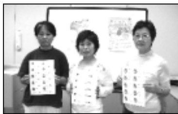
7月3日の受講生のみなさんです。

私たちマルボラも時代の流れに遅れることなく、皆さんの要望に応えられるように頑張っています。「手ほどき」を大いに利用してください。お待ちしております。